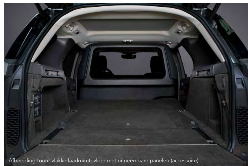
Afbeelding toont vlakke laadruimtevloer met uitneembare panelen (accessoire).