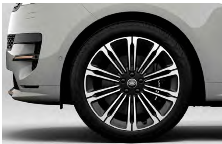
23" 10-SPLIT SPOKE 'STYLE 1075' DIAMOND TURNED FINISH & CONTRAST GLOSS DARK GREY