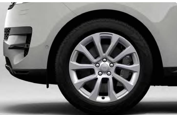
21" 5-SPLIT SPOKE 'STYLE 5126' GLOSS SPARKLE SILVER Standaard op Range Rover Sport SE