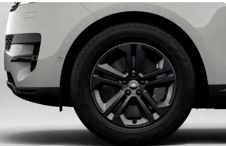
20" 5-SPLIT SPOKE 'STYLE 5125' SATIN DARK GREY