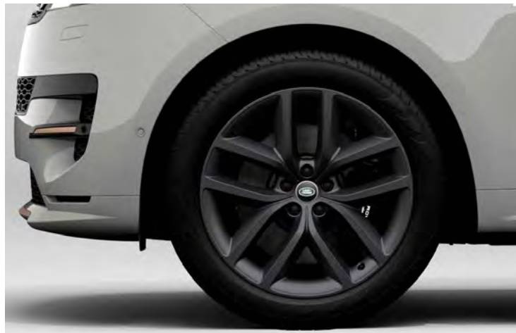
22" 5-SPLIT SPOKE 'STYLE 5127' SATIN DARK GREY Standaard op Range Rover Sport Dynamic HSE

Er is keuze uit een uitgebreid programma lichtmetalen velgen. De maten variëren van 21" tot een bijzonder aantrekkelijke 23". De markante designkenmerken voegen stuk voor stuk hun specifieke karakter toe aan de uitstraling van de auto. In de configurator op landrover.nl kunt u zien welke velgen beschikbaar zijn voor uw gewenste uitvoering.