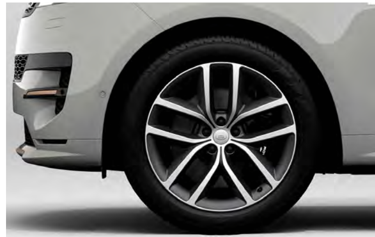
22" SV BESPOKE 5-SPLIT SPOKE 'STYLE 5127' DIAMOND TURNED FINISH & CONTRAST SATIN DARK GREY