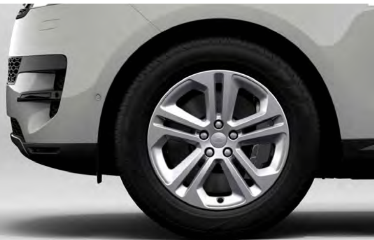
20" 5-SPLIT SPOKE 'STYLE 5125' GLOSS SPARKLE SILVER Standaard op Range Rover Sport S

Er is keuze uit een uitgebreid programma lichtmetalen velgen. De maten variëren van 20" tot een bijzonder aantrekkelijke 23". De markante designkenmerken voegen stuk voor stuk hun specifieke karakter toe aan de uitstraling van de auto. In de configurator op landrover.nl kunt u zien welke velgen beschikbaar zijn voor uw gewenste uitvoering.