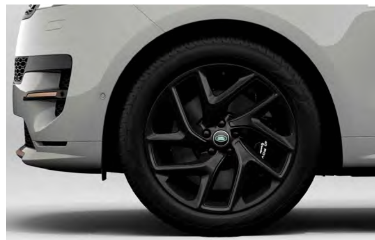
22" SV BESPOKE 5-SPLIT SPOKE 'STYLE 5131' SATIN BLACK & CONTRAST GLOSS BLACK