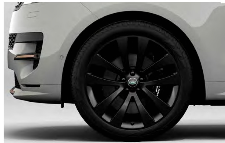
23" 5-SPLIT SPOKE 'STYLE 5135' GLOSS BLACK