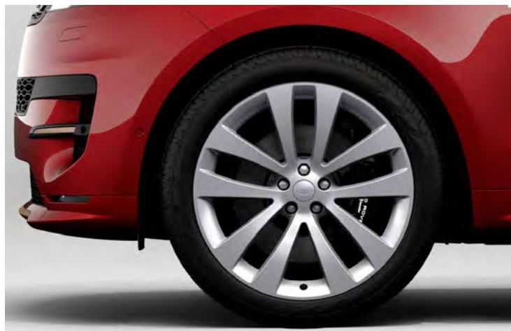
23" 5-SPLIT SPOKE 'STYLE 5135' GLOSS SPARKLE SILVER Standaard op Range Rover Sport First Edition