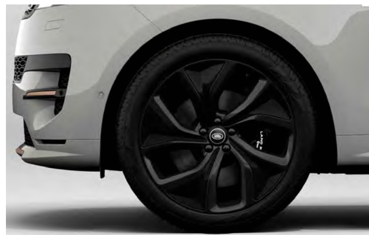
23" SV BESPOKE 5-SPLIT SPOKE 'STYLE 5128' DARK GREY MET ACCENTEN IN GLOSS BLACK CARBON