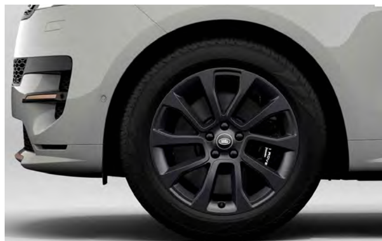
21" 5-SPLIT SPOKE 'STYLE 5126' SATIN DARK GREY Standaard op Range Rover Sport Dynamic SE