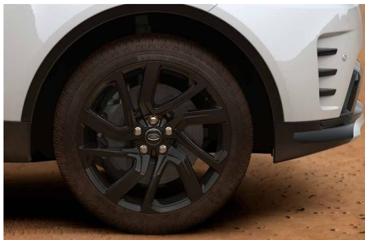
21" 5-SPLIT SPOKE 'STYLE 5025' GLOSS BLACK Standaard op Discovery R-Dynamic SE