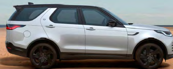
METALLIC HAKUBA SILVER