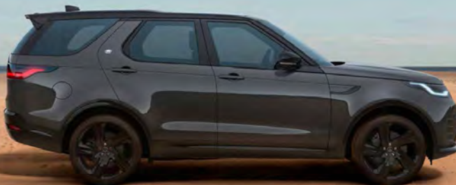
PREMIUM METALLIC CARPATHIAN GREY