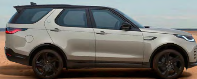
METALLIC LANTAU BRONZE