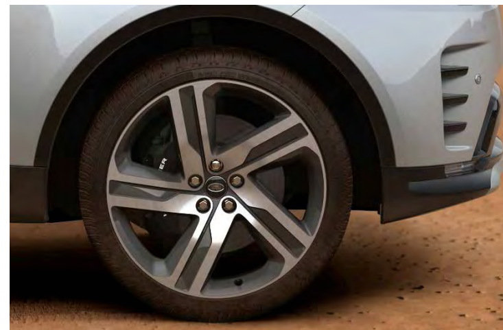
22" 5-SPLIT SPOKE 'STYLE 5124' GLOSS DARK GREY & CONTRAST DIAMOND TURNED FINISH Standaard op Discovery Metropolitan Edition