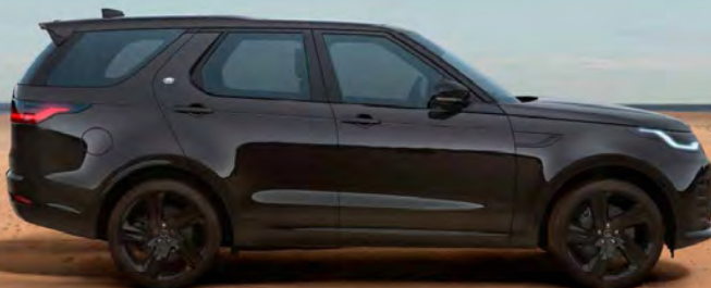
METALLIC SANTORINI BLACK