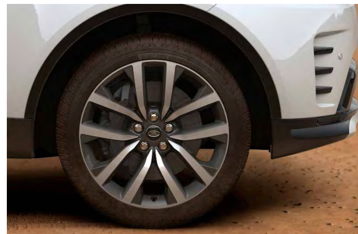
21" 5-SPLIT SPOKE 'STYLE 5123' GLOSS DARK GREY & CONTRAST DIAMOND TURNED FINISH