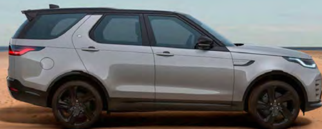
METALLIC EIGER GREY