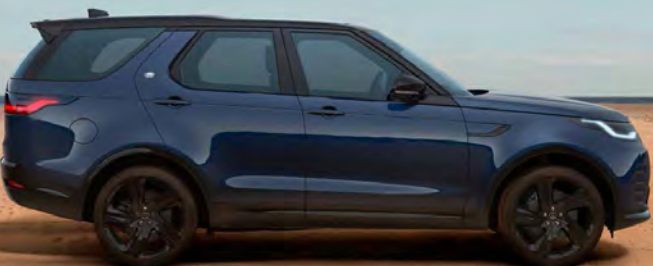
METALLIC PORTOFINO BLUE