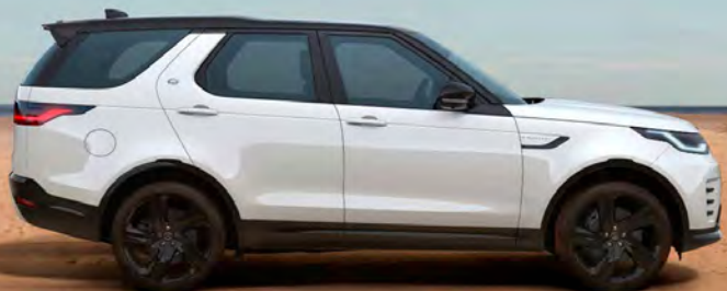
SOLID FUJI WHITE