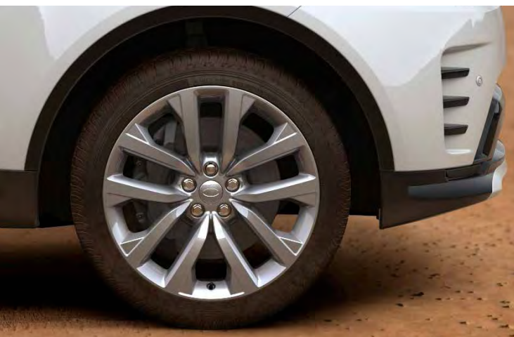
21" 5-SPLIT SPOKE 'STYLE 5123' GLOSS SILVER