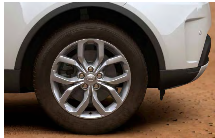
19" 5-SPLIT SPOKE 'STYLE 5021' GLOSS SPARKLE SILVER Standaard op Discovery

Er is keuze uit een uitgebreid programma lichtmetalen velgen. De maten variëren van 19" tot een bijzonder aantrekkelijke 22". De markante designkenmerken voegen stuk voor stuk hun specifieke karakter toe aan de uitstraling van de auto. In de configurator op landrover.nl kunt u zien welke velgen beschikbaar zijn voor uw gewenste uitvoering.