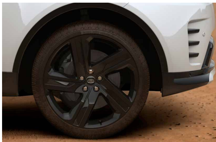
22" 5-SPLIT SPOKE 'STYLE 5124' GLOSS BLACK Standaard op Discovery R-Dynamic HSE